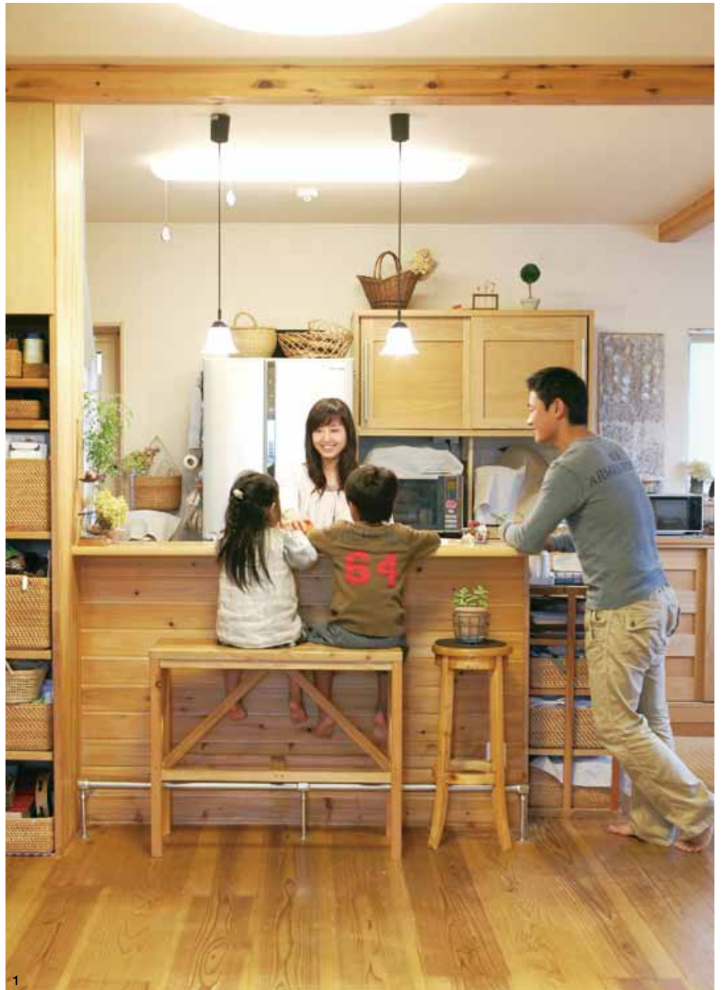
1. 雑貨や籠が木の質感にぴったり。素朴でぬくもりを感じる室内 2.2階の空間を繋ぐ吹き抜けは開放感いっぱい 3. パソコン机にも一工夫。使わない時には扉を引き下ろせばマガジンラックに早変わり 4. 現し梁が空間を引き締めるLDK。フローリングは幅広の板材で重厚感も演出 5. 三角屋根のかわいらしい外観。深めの軒を架けたウッドテラスでは子どもたちが遊んだり、バーベキューを楽しんだり